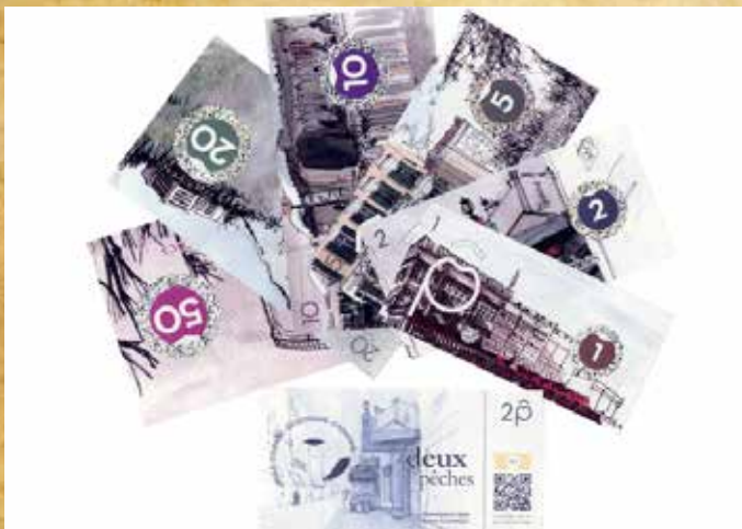
Participation au réseau de la Monnaie Locale "La Pêche"