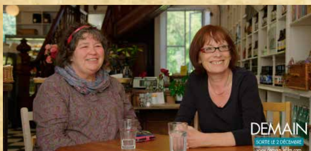
Les fondatrices des Incroyables comestibles