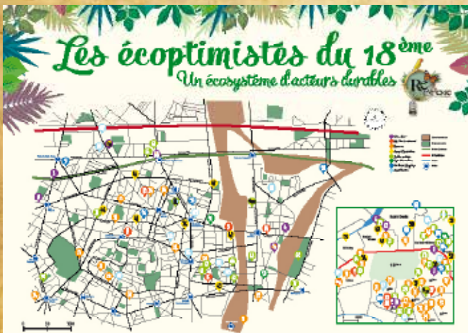
Identification et création de l'écosystème des acteurs durables des environs de la REcyclerie "Les Ecooptimistes du 18e"