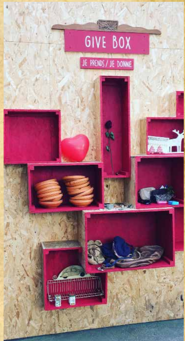
Installation d'une "give box" sur le modèle allemand